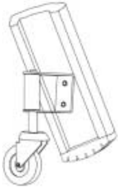
Bild 4: Federgelagerte Lenkrolle