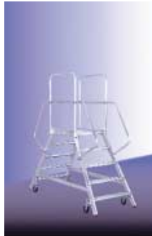
Bild 2: Rollpodest, beidseitig begehbar