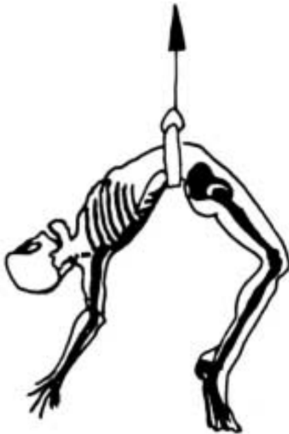
Bild 2: Gefahr der Wirbelsäulenverletzung bei der Benutzung von Haltegurten zum Auffangen

Als Haltegurt können auch Auffanggurte mit integrierter Haltefunktion benutzt werden.